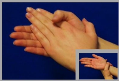
1. Handflächen und -gelenke