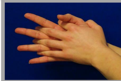
2. Zwischen den Fingern