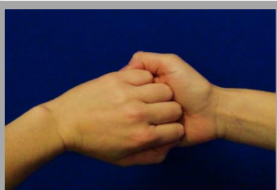
4. Außenseiten der Finger